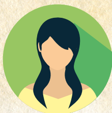
Image qui représente l'héroïne (image imprimée, dessinée, décalquée...)

Résumé de ses principales actions en 5 à 10 lignes