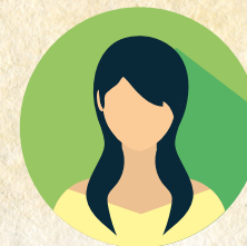
Image qui représente l'héroïne (image imprimée, dessinée, décalquée...)

Résumé de ses principales actions en 5 à 10 lignes